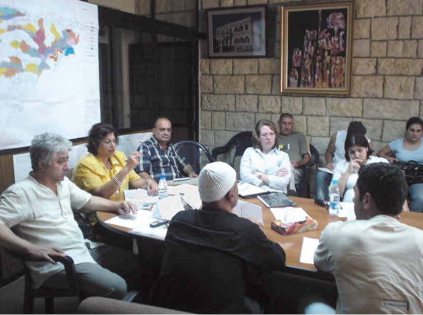
مجموعة تركيز بلدية بعقلين

المجلس البلدي» (مادة ٤٧). فهو بالتالي يعدد، في المواد من ٤٩ إلى ٥٥ من قانون البلديات، مجالات عمل المجلس البلدي، دون أن يكون ذلك على سبيل الحصر، مما يدل على شمولية هذه المهام لمختلف جوانب الحياة العامة وتناولها مختلف القطاعات ضمن النطاق المحلي.