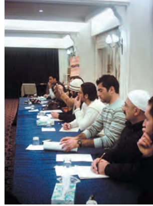
ورشة عمل انتاج دليل الشباب والبلديات