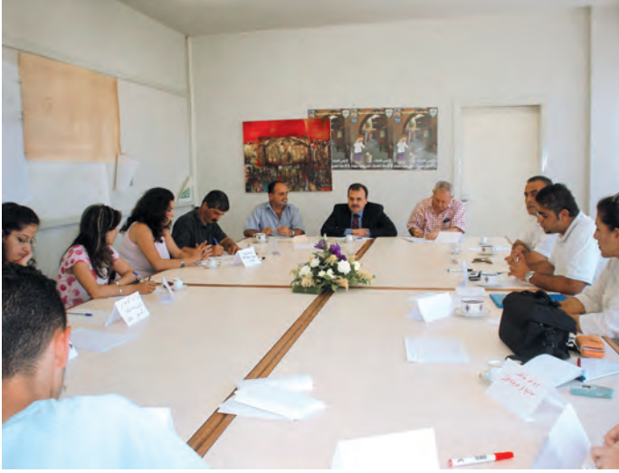
مجموعة تركيز بلدية صيدا

يقدم هذا الدليل أفكار واقتراحات حول كيفية مشاركة الشباب في أعمال البلديات أكثر مما يشكل بحثاً علمياً بحتاً. والغاية منه مزدوجة، ثقافية وتدريبية. إضافة إلى عرض لتكوين المجالس البلدية وشرح لطبيعة عملها